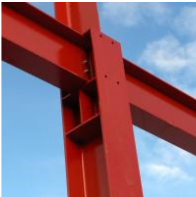
Progettazione edile e strutturale

e-mail: info@cierreingegneria.it - www.cierreingegneria.it