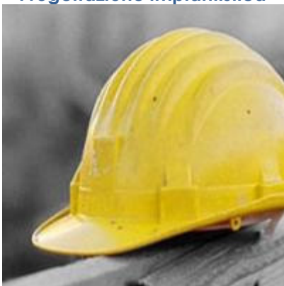
Sicurezza e direzione lavori