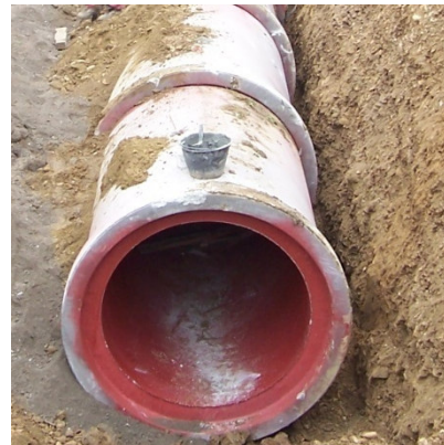
Progettazione opere infrastrutturali